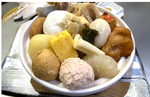
一番人気のおでん鍋