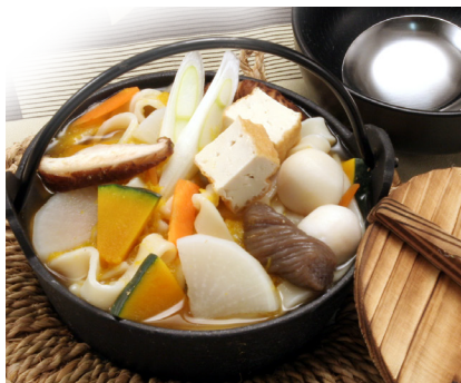
深谷名物煮ほうとう鍋