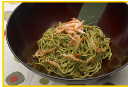
さくら海老のペペロンチーノ和風そば