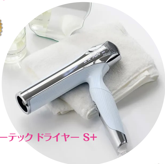
リファビューテックドライヤー S+