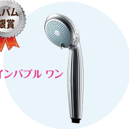
リファファインバブルワン