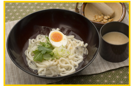
冷やしつけ麺うどん胡麻ダレ