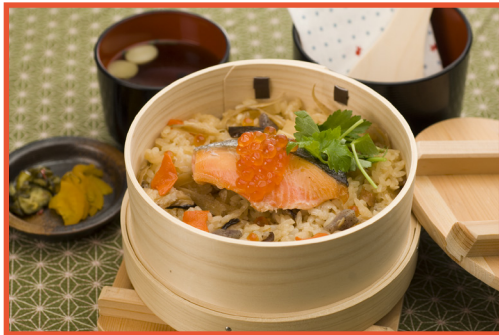
北海五目わっぱめし