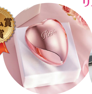
リファハートブラシ or リファハートコム アイラ