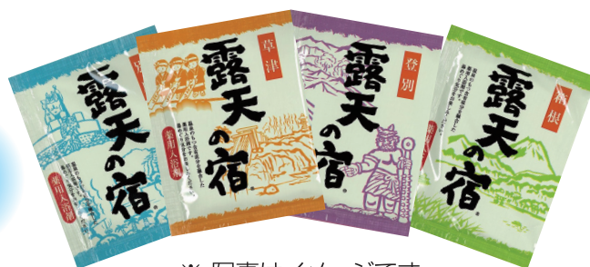
※ 写真はイメージです。